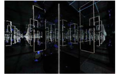
神戸ビエンナーレ 2013