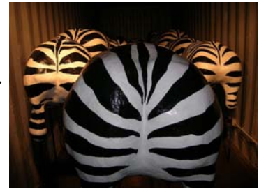
神戸ビエンナーレ 2007