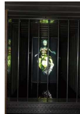
神戸ビエンナーレ 2007