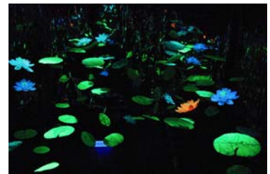
神戸ビエンナーレ 2013