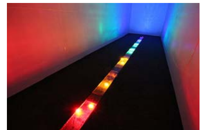
神戸ビエンナーレ 2013