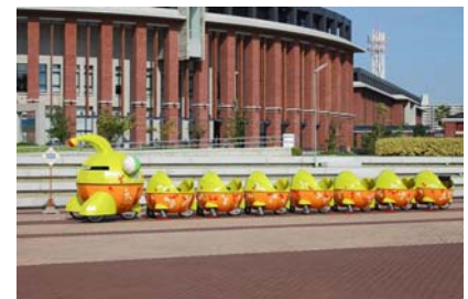
神戸ビエンナーレ 2011