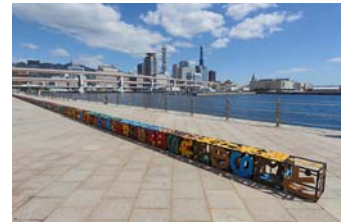
神戸ビエンナーレ 2013

2013年 神戸ビエンナーレ 2013 しつらいアート国際展 神戸ビエンナーレ大賞