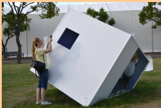
「帆/立方体/傾いた茶室」