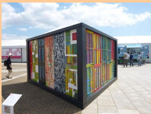
「我、知らず、その好奇心」