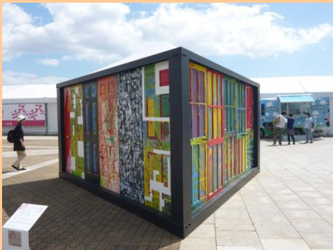
「我、知らず、その好奇心」