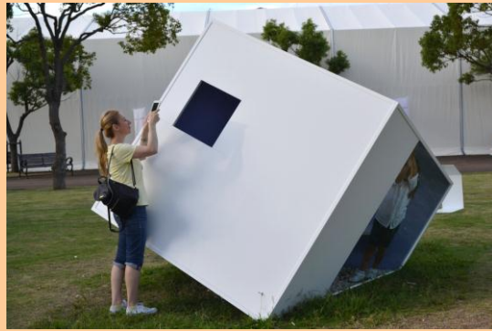
「帆/立方体/傾いた茶室」